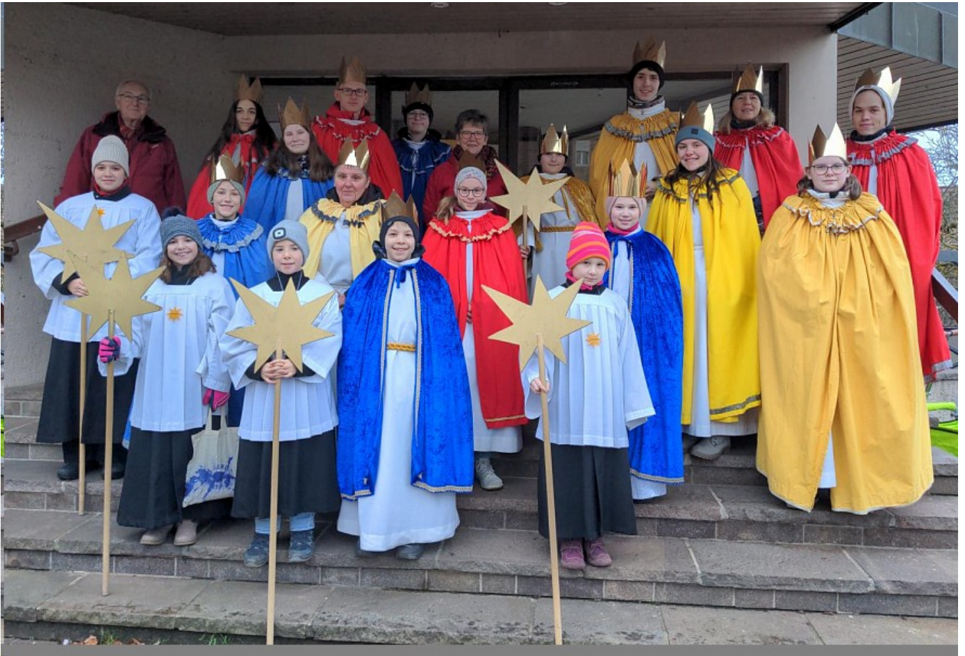
Sternsinger von Sendelbach