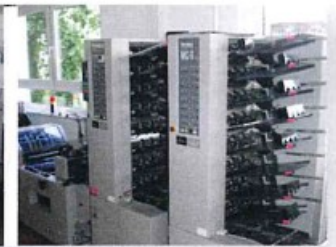
SCHNEIDEN, FALZEN & BINDEN

Pfarrbriefe, Plakate, Briefbogen, Visitenkarten, Stempel, Selbstdurchschreibeformulare, Urkunden, Einladungen, Diplom- arbeiten, Buchbindearbeiten, Trauerdrucksachen, . . .