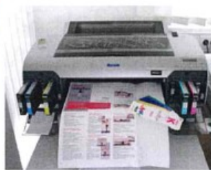
SATZ & LAYOUT